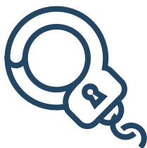
Арест до 3 месяцев

Наказывается арестом, обязательными, исправительными работами или штрафом: