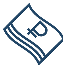
Штраф до 40 000 ₽

Те же деяния, совершенные группой лиц, а равно по мотивам политической, идеологической, расовой, национальной или религиозной ненависти или вражды либо по мотивам ненависти или вражды в отношении какой-либо социальной группы: