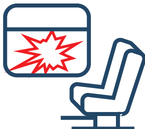
Разбитые стекла в вагоне поезда