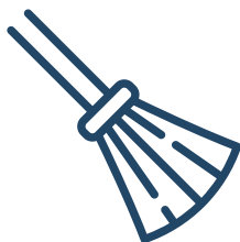
Обязательные работы до 360 часов, исправительные работы до 1 года